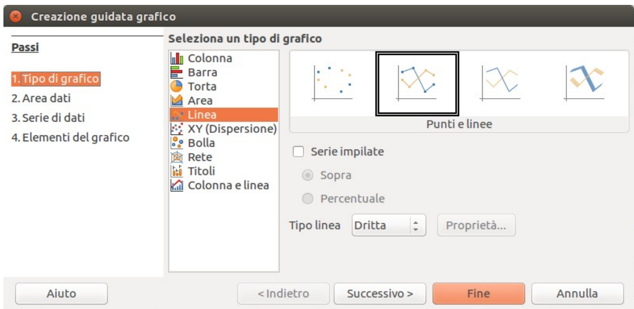
Figura 1: Tipo di grafico