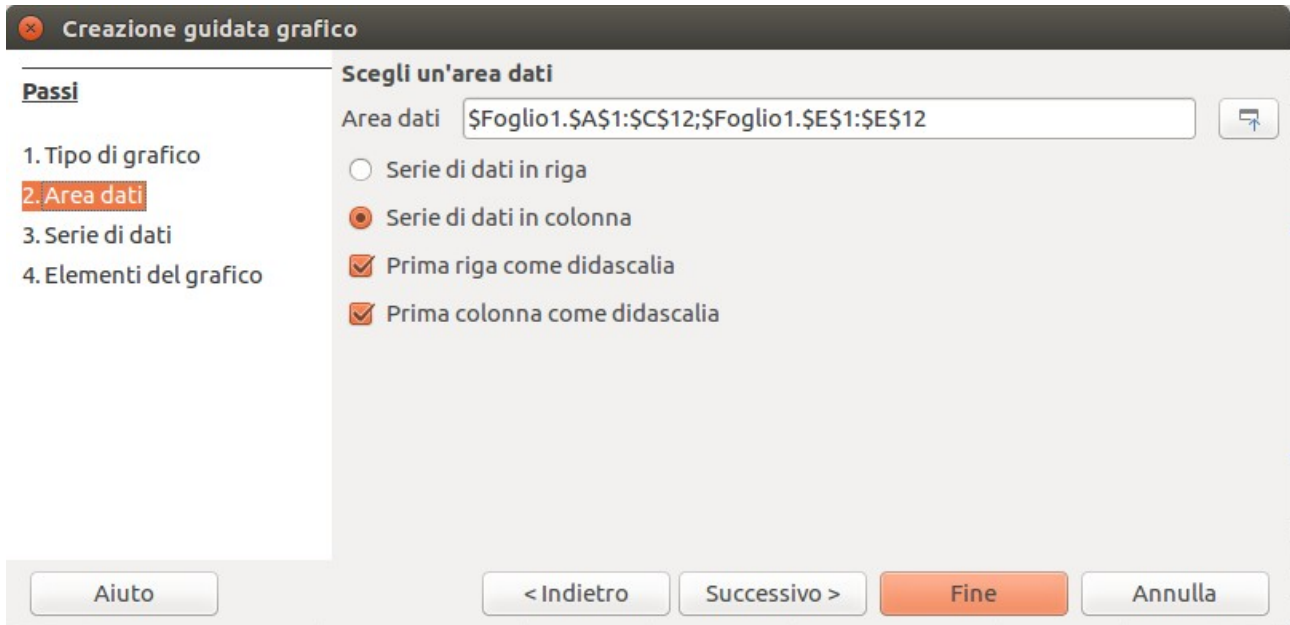
Figura 2: Area dati